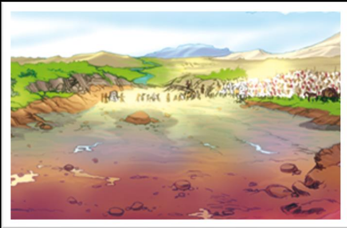
La terre promise