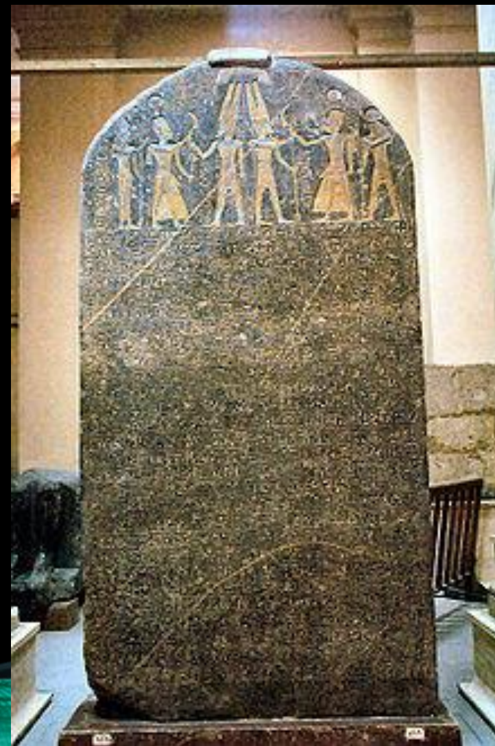
Stèle de Mérenptah

"Canaan a été dépouillé. Ascalon a été enlevée. Gézer a été vaincue. Yénoam est comme si elle n'avait pas existé. Israël est dévasté, sa semence n'existe plus. La Syrie est devenue une veuve pour l'Égypte. Tous les pays sont unis; ils sont en paix."