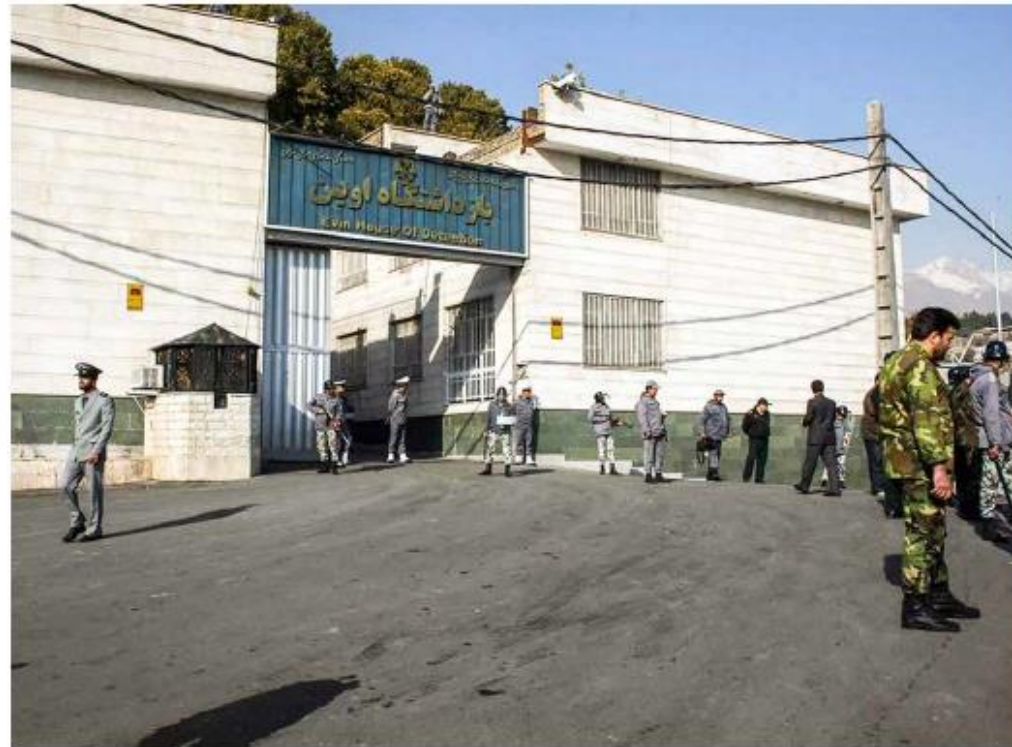
Prison de Evin à Téhéran

« Souvenez-vous de ces premiers jours... »